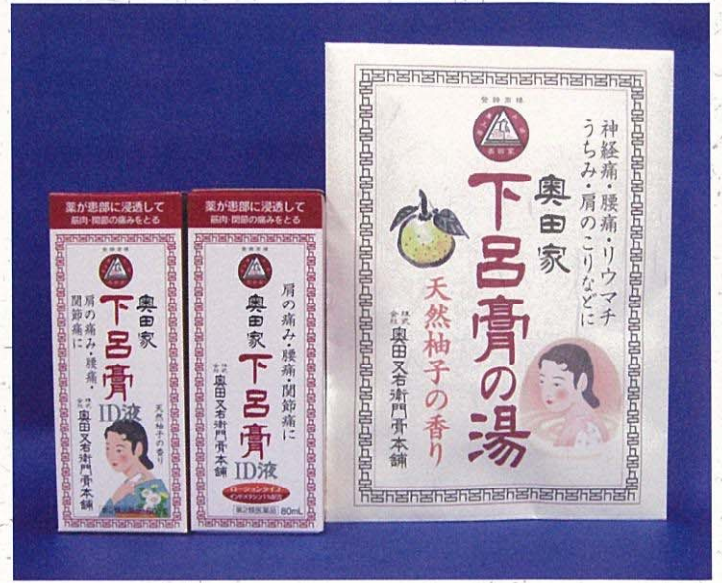
含有生药配方的药用入浴剂和外擦药

下吕温泉传统的膏药“下吕膏”具有良好的止痛疗效，一直是深受日本人喜爱的畅销商品。特别适合作为馈赠佳品。