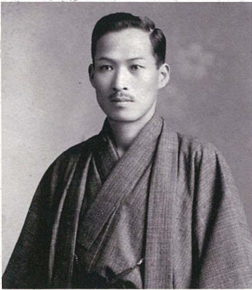
有名的正骨院世家奥田家的祖传秘方