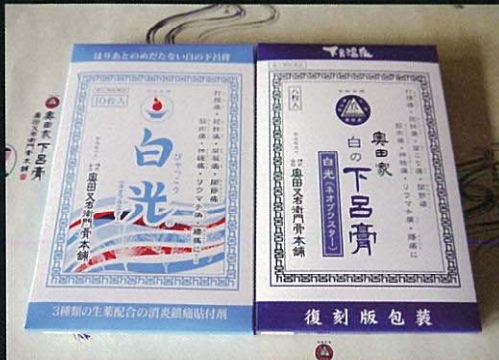
配有中医生药。能缓解肩酸和腰痛，肌肉痛等疼痛。

“下吕膏”是自古以来流传于具有“日本三大名泉”美称的“下吕温泉”的一种膏药，由于它所含有的黄檗、杨梅皮等中医生药成分有很好的止痛疗效，所以可以缓解扭伤、磕碰、肩酸等疼痛和关节痛、风湿、腰痛等慢性疼痛。虽然采用传统配方的“奥田家下吕膏【黑下吕膏】”对于慢性疼痛等症状特别值得推荐，但是，残留的黑色贴痕却是它的一大难点。而经过改良，使贴痕淡化并增强了消炎能力的“白光【白下吕膏】”目前倍受欢迎，以中部圈为中心在日本全国的药店及药房均有销售。本产品选用了颇受好评的传统工艺品——美浓和纸，并设法优化了渗透效果和透气性能，因此夸赞“治疗肩酸腰痛，白光【白下吕膏】最佳”的回头客也很多。在下吕温泉还销售含有下吕天然山白竹配方的限定商品——“超级膏药【绿下吕膏】”。此膏药对急性疼痛有很好的疗效，还带有薄荷脑和山白竹清爽的香味儿。还有仅限定在下吕温泉销售的直接涂在患部的下吕膏。专程到下吕温泉来购买的客人也很多。