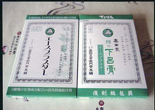
清凉的超级膏药【绿下吕膏】